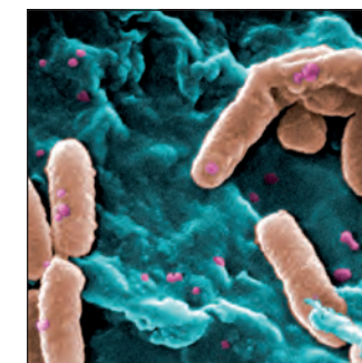
Author: CDC/Janice Haney Carr

Ablagerungen und Verunreinigungen auf Hörsystemen und Ohrpassstücken gehören ebenfalls zu den völlig normalen Auswirkungen von Trageweise und Tragedauer. Viel mehr sind sie sogar das positive Anzeichen dafür, dass die Hörsysteme und Otoplastiken regelmäßig und gerne getragen werden.